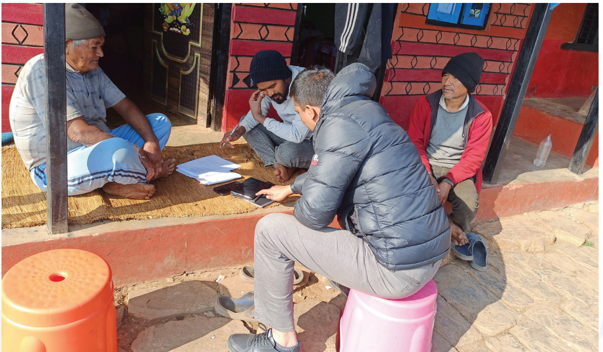
आयोजना प्रभावित परिवारहरूको सामाजिक-सांस्कृतिक, जनसाङ्ख्यिकी तथा आर्थिक जानकारीहरू प्राप्त गर्नका लागि तनहुँ जिल्लामा घरपरिवार सर्वेक्षण गरिँदै ।

एमसिए-नेपालले एमसिए-नेपाल सञ्चालक समितिले पारित गरेको पुनर्वास नीति संरचना अनुसार आयोजना प्रभावित परिवारहरूको सामाजिक-सांस्कृतिक, जनसाङ्ख्यिकी तथा आर्थिक जानकारीहरू प्राप्त गर्नका लागि विद्युत् प्रसारण आयोजना प्रभावित दश वटा जिल्लामध्ये नौ वटा जिल्लामा घरपरिवार तथा भौतिक क्षतिसम्बन्धी सर्वेक्षण गरेको छ ।