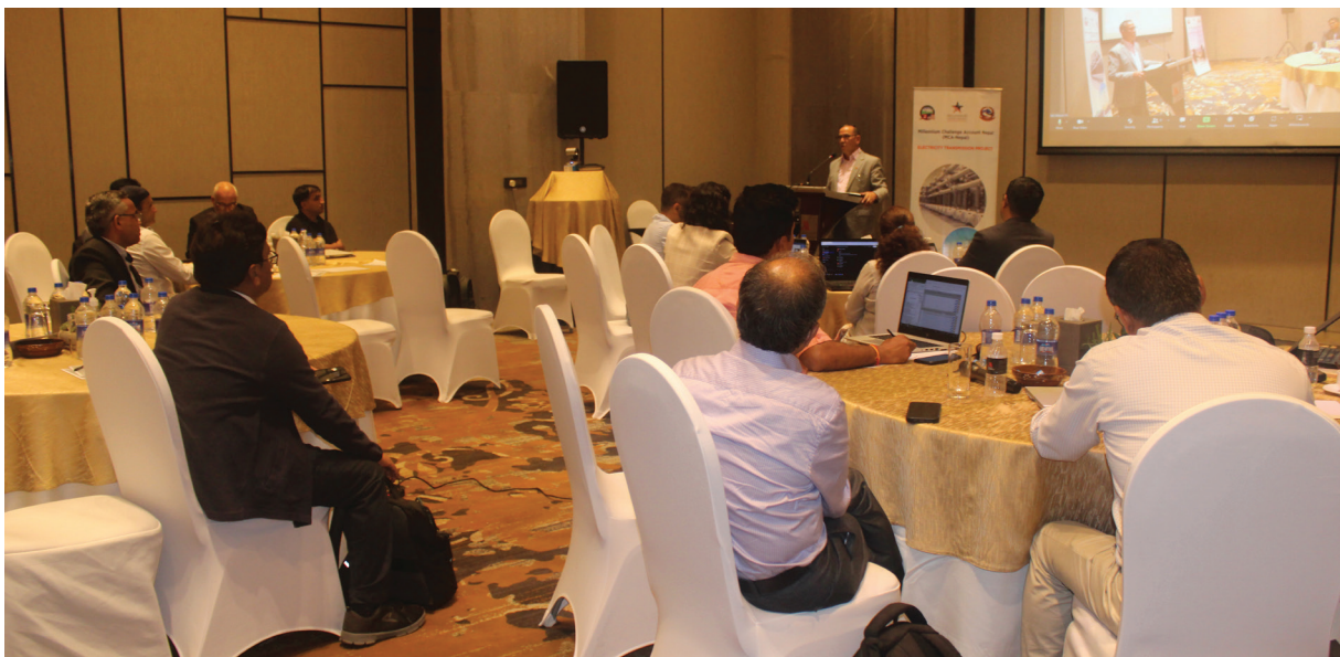
ऊर्जा क्षेत्र प्राविधिक सहयोग क्रियाकलापसम्बन्धी खरिदबारे काठमाडौंमा २०८० साउन १६ गते आयोजित छलफल कार्यक्रम ।