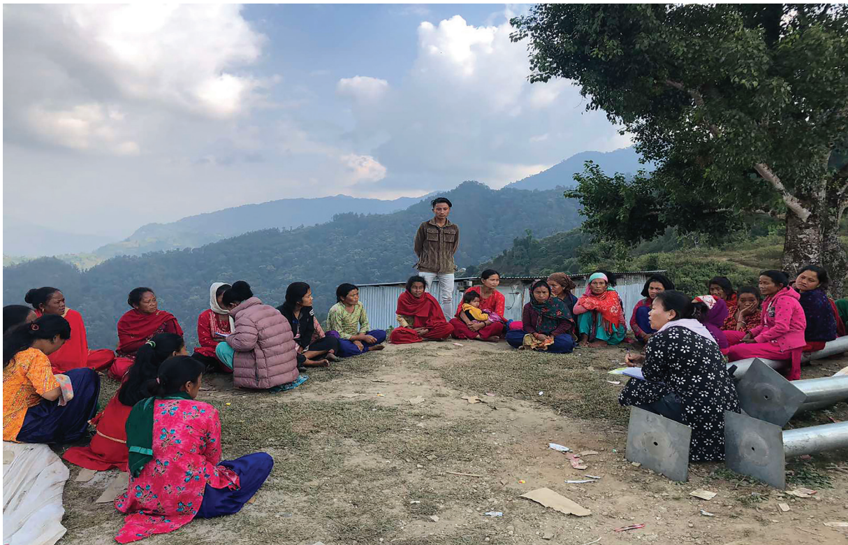
मकवानपुरको कैलाश नगरपालिकामा आयोजना प्रभावित महिलाहरूसँग आयोजना गरिएको विषय केन्द्रित छलफल ।

एमसिए-नेपालले स्थानीय समुदायका सामाजिक आयामहरूलाई बुझ्नका लागि नगरपालिकाका उप-प्रमुखहरू, वडा सदस्यहरू, विद्यालयका शिक्षक शिक्षिकाहरू तथा प्रहरी अधिकृतहरूको सहभागितामा विद्युत् प्रसारण आयोजनाबाट प्रभावित नौ जिल्लाहरूमा विषय केन्द्रित छलफलहरू तथा मुख्य सूचना प्रदायक अन्तरवार्ताहरू सञ्चालन गरेको छ । प्रसारण लाइन पुनर्वासि कार्ययोजनाद्वारा सिर्जना गरिएको जग्गा प्राप्तिका प्रभावहरू तथा तिनीहरूलाई न्यूनीकरण गर्ने उपायहरू पहिचान गर्नका लागि लैङ्गिक तथा सामाजिक समावेशीकरणसम्बन्धी मुद्दाहरू कार्यान्वयन गर्न पर्ने आवश्यकता अन्तर्गत यी कार्यक्रम कार्यान्वयन गरिएको थियो ।