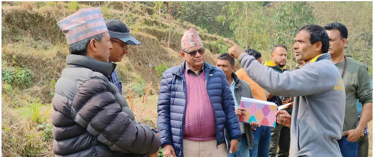
प्राप्तिका लागि पहिचान गरिएका जग्गाको प्रमाणीकरणका लागि सिन्धुपाल्चोक जिल्लामा स्थलगत भ्रमण गर्नुहुँदै मुआब्जा निर्धारण समिति मातहत गठन गरिएको उप-समितिका सदस्यहरू ।