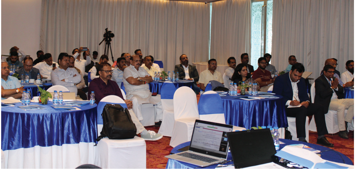
सडक मर्मत आयोजनासम्बन्धी खरिदबारे भारतको नयाँ दिल्लीमा २०८१ साल वैशाख ३ गते आयोजित छलफल कार्यक्रममा सहभागीहरू ।