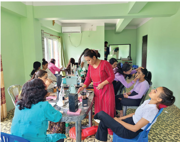
ब्यूटिसियन पुनःताजगी प्रशिक्षणमा भाग लिँदै आयोजना प्रभावित महिलाहरू।