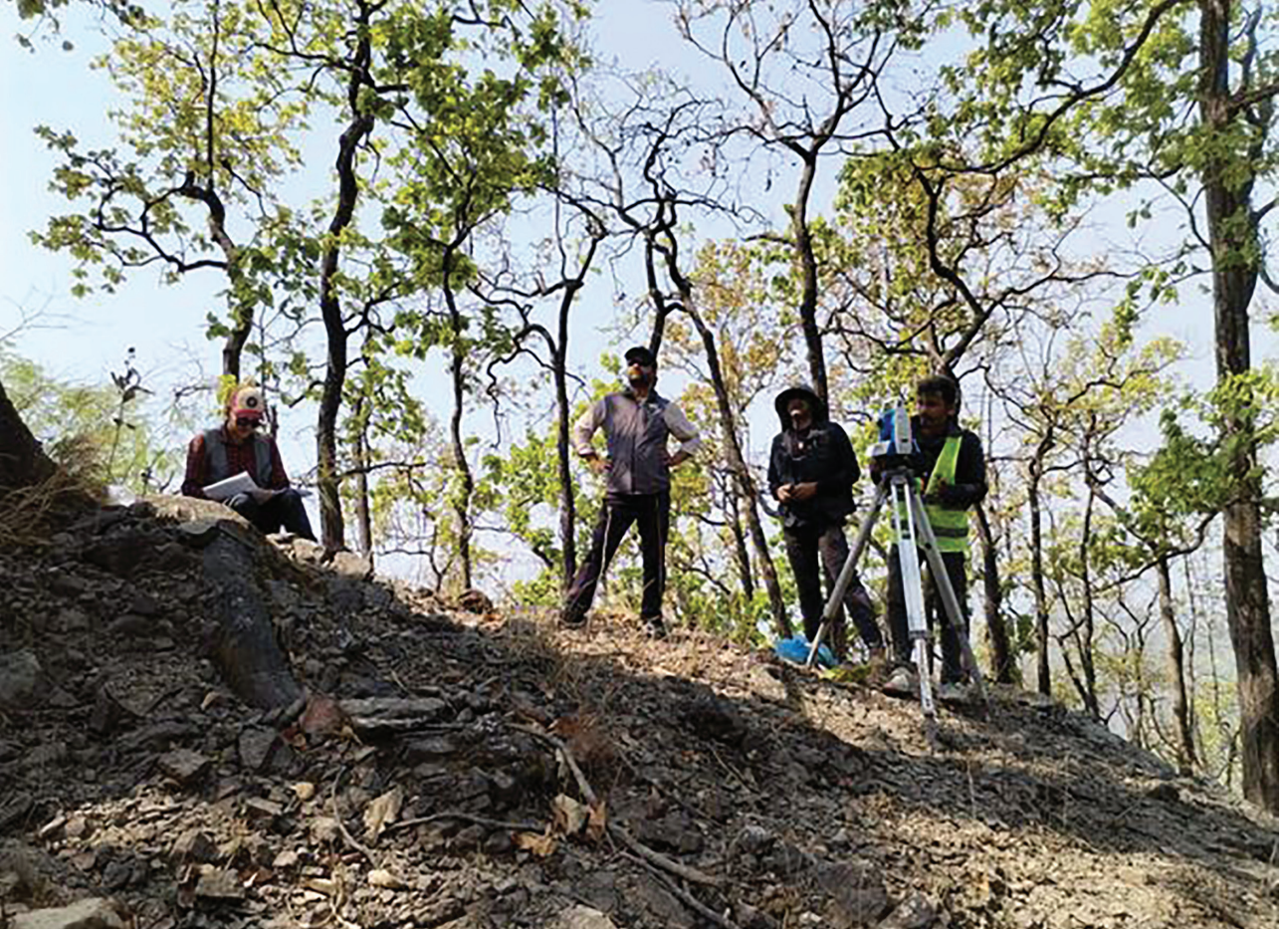
प्रसारण लाइन मार्गमा टावरको जग निर्माणका लागि आवश्यक अस्थायी पहुँच मार्गसम्बन्धी इन्जिनियरिङ सर्वेक्षण हुँदै ।