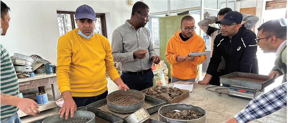
फटिंग कर्भ तयारीसम्बन्धी एक अभिमूर्खीकरण कार्यक्रममा प्रयोगशाला प्राविधिज्ञहरू ।