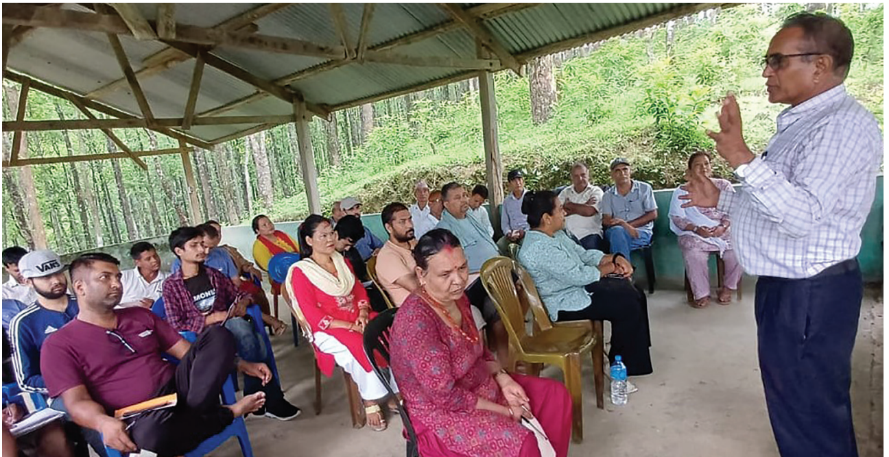
विद्युत् प्रसारण आयोजनाबाट प्रभावित मकवानपुर जिल्लाका सामुदायिक र कबुलियती वन उपभोक्ता समूहसँग सञ्चालित दोस्रो चरणको परामर्श कार्यक्रम ।