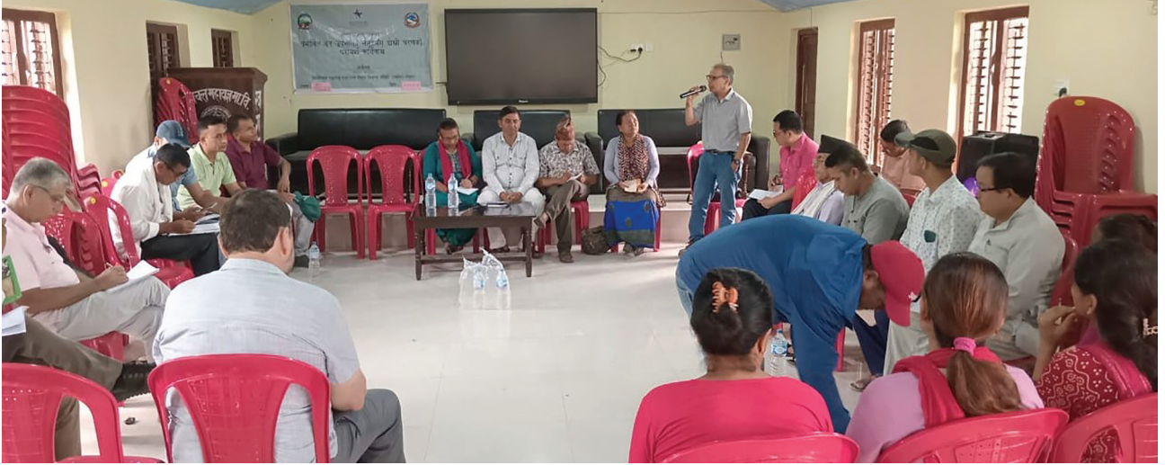
विद्युत् प्रसारण आयोजनाबाट प्रभावित नवलपरासी (बर्दघाट सुस्ता पश्चिम) जिल्लाका सामुदायिक र कबुलियती वन उपभोक्ता समूहसँग सञ्चालित दोस्रो चरणको परामर्श कार्यक्रम ।