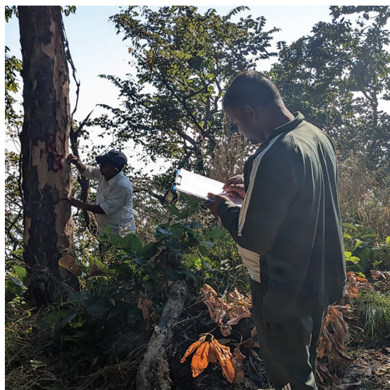
नवलपरासी (बर्दघाट सुस्ता पश्चिम) जिल्लामा रुख गणना गरिँदै ।

डिभिजन वन अधिकृतहरूको नेतृत्वमा रहेका रुख गणना टोलीलाई अभिमूखीकरण गरिएपछि एमसिए-नेपालले वातावरणीय प्रभाव मूल्याङ्कन अनुमान गरिएको वन क्षेत्र र रुखको सङ्ख्या प्रमाणीकरण गर्न आफ्नो टोलीलाई विद्युत् प्रसारण आयोजना सञ्चालन गरिने क्षेत्रमा रुख गणनाका लागि पठाएको थियो । उक्त गणना कार्य धादिङ जिल्लाबाट शुरु गरिएको थियो र विद्युत् प्रसारण आयोजना सञ्चालन गरिने जिल्लाहरूमा रुख गणना गर्न तथा प्रमाणीकरण गर्नका लागि वन क्षेत्रको सीमाङ्कन गर्न स्थायी किलो गाडिएको थियो । दश वटा प्रभावित जिल्लामध्ये नौ वटा जिल्लामा रुख गणना कार्य २०८१ सालको जेठमा सम्पन्न भएको छ ।