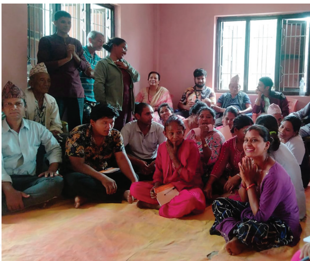
विद्युत् प्रसारण आयोजनाबाट प्रभावित धादिङ जिल्लाका सामुदायिक र कबुलियती वन उपभोक्ता समूहसँग सञ्चालित दोस्रो चरणको परामर्श कार्यक्रम ।