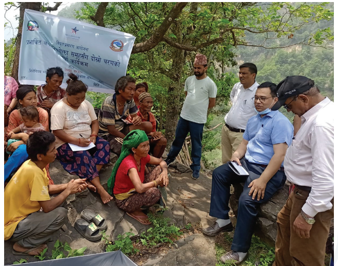
विद्युत् प्रसारण आयोजनाबाट प्रभावित चितवन जिल्लाका सामुदायिक र कबुलियती वन उपभोक्ता समूहसँग सञ्चालित दोस्रो चरणको परामर्श कार्यक्रम ।