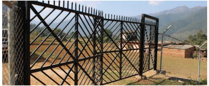
नुवाकोटको बेलकोटगढीमा रातमाटे सबस्टेशन निर्माणका लागि प्राप्त गरेको करिब २०.२७ हेक्टर जग्गा वरिपरि लगाइएको तारबार ।

एमसिए-नेपालले नुवाकोटको बेलकोटगढी नगरपालिका-७ मा रातमाटे सबस्टेशन निर्माणका लागि प्राप्त गरेको करिब २०.२७ हेक्टर जग्गा वरिपरि तारबार लगाउने कार्य सम्पन्न भएको छ । निर्माण कार्यको तयारीका क्रममा प्राप्त गरिएको जग्गाको सुरक्षार्थ उक्त दुई हजार एक सय मिटर लामो तारबार लगाइएको हो