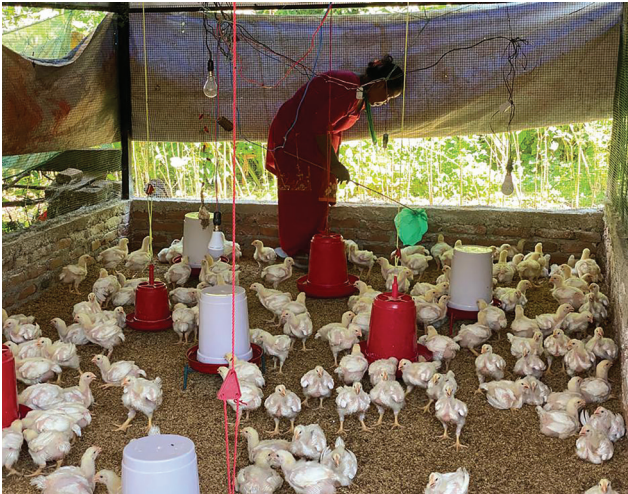
कुखुरापालन प्रशिक्षणप्राप्त एक आयोजना प्रभावित महिला आफ्ना कुखुराका चल्ला स्याहाउँदै।

समग्र रूपमा जीविकोपार्जन पुनःस्थापना कार्यक्रमले कृषि उत्पादकत्वमा अभिवृद्धि गरी आयस्तर तथा उन्नत रोजगारीका लागि आवश्यक सीपलाई उकासेको छ। फलस्वरूप ३४ जना आयोजना प्रभावित व्यक्तिहरूले रोजगारी पाएका छन् भने ३९ जनाले आफ्नै व्यवसाय शुरु गरेका छन्।