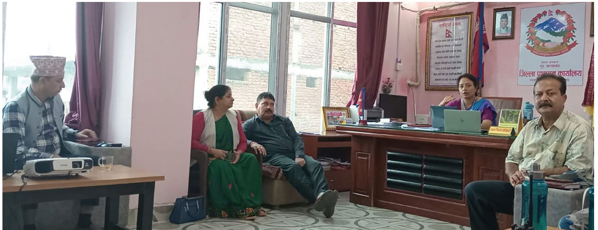
नवलपरासी (बर्दघाट सुस्ता पश्चिम) जिल्लामा विद्युत् प्रसारण टावरका जगहरू निर्माणका लागि आवश्यक जग्गाको मुआब्जा दर निर्धारण गर्न २०८१ साल असार २३ गते बसेको मुआब्जा निर्धारण समितिको बैठक ।