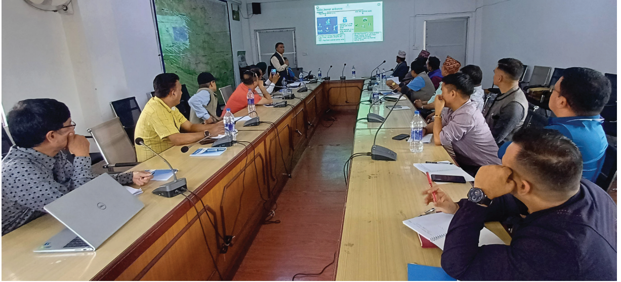
मकवानपुर जिल्लामा विद्युत् प्रसारण टावरका जगहरू निर्माणका लागि आवश्यक जग्गाको मुआब्जा दर निर्धारण गर्न २०८१ साल वैशाख २८ गते बसेको मुआब्जा निर्धारण समितिको बैठक ।

यस अघि एमसिए-नेपालले जग्गाको मूल्याङ्कन सिफारिशका लागि ती जिल्लामा मुआब्जा निर्धारण समितिहरूको मातहत सहायक प्रमुख जिल्ला अधिकारीको नेतृत्वमा गठन गरिएका उप-समितिहरूलाई स्थलगत भ्रमण गराएको थियो । उक्त भ्रमणमा सम्बन्धित सरकारी कार्यालयहरूका प्रतिनिधिहरूका साथै निर्वाचित जनप्रतिनिधिहरूको पनि सहभागिता रहेको थियो ।