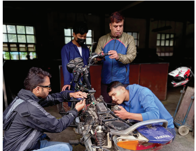
आयोजना प्रभावित व्यक्तिहरू अटोमोबाइल मेकानिक प्रशिक्षण लिँदै।