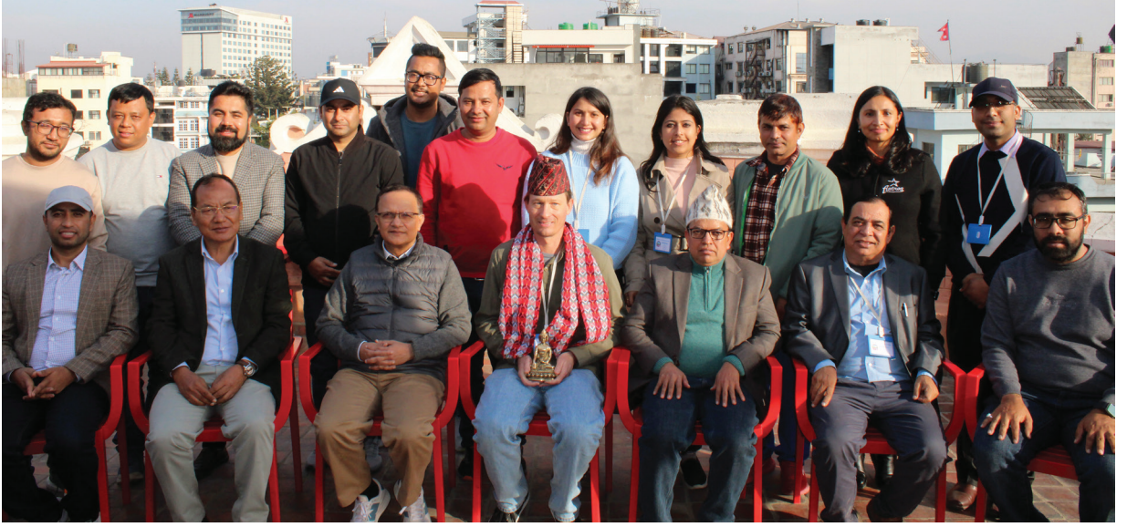
इण्टरनेशनल रफनेस इण्डेक्स क्लास २ उपकरण जडान तथा तथ्याङ्क सङ्कलन तालिमका मोत व्यक्तिहरू तथा प्रशिक्षार्थीहरू ।