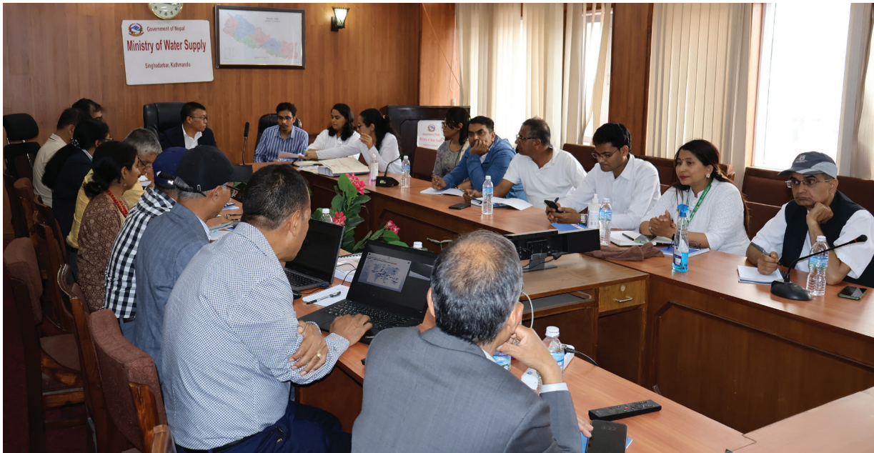
पूर्व - पश्चिम राजमार्गको धानखोलादेखि लमहीसम्मको ४० किमि सडक खण्डको मर्मतका लागि तयार गरिएको प्रारम्भिक वातावरणीय परीक्षण प्रतिवेदनसम्बन्धमा आयोजित छलफल कार्यक्रम ।

अन्तरराष्ट्रिय वित्त निगमको कार्यसम्पादन मापदण्ड अनुसार सडक मर्मत आयोजना अन्तर्गत पूर्व - पश्चिम राजमार्गको दाङ जिल्लामा पर्ने धानखोलादेखि लमहीसम्मको ४० किमि सडक खण्डको स्तरोन्नतिका लागि प्रारम्भिक वातावरणीय परीक्षण प्रतिवेदन तयार गरेको छ । उक्त प्रतिवेदन भौतिक पूर्वाधार तथा यातायात मन्त्रालयमा २०८१ साल जेठ २० गते प्रस्तुत गरिएको थियो ।