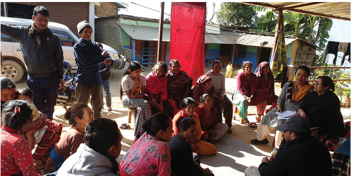
धादिङमा आमा समूहहरू र सामुदायिक वन उपभोक्ता समूहका सदस्यहरूसँग आयोजना गरिएको विषय केन्द्रित छलफल ।

मानव ओसारपसार तथा बेचबिखनसम्बन्धी शङ्कास्पद घटनाबारे गोप्य रूपमा जानकारी दिने संयन्त्र स्थापना गर्नुपर्नेसम्बन्धमा एमसीसीको मानव ओसारपसार तथा बेचबिखनविरुद्ध नीति, सन् २०२१ मा गरिएको व्यवस्थाको पालना गर्दै एमसिए-नेपालले मानव ओसारपसार तथा बेचबिखनसम्बन्धी गुनासो दर्ता प्रणालीका रूपमा मानव ओसारपसार तथा बेचबिखन सम्बोधनसम्बन्धी प्रोटोकल मसौदा गरेको छ ।