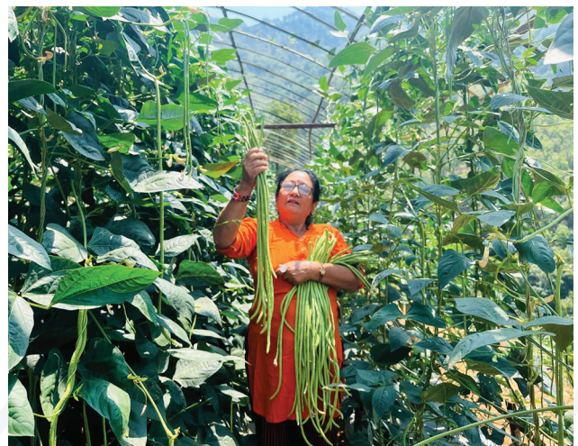
व्यावसायिक कृषिसम्बन्धी प्रशिक्षणप्राप्त एक आयोजना प्रभावित महिला आफ्ना उत्पादन टिउँदै।