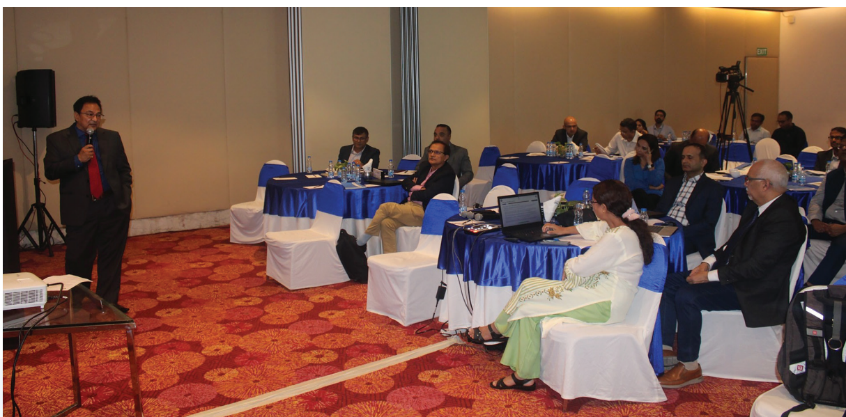
ऊर्जा क्षेत्र प्राविधिक सहयोग क्रियाकलापसम्बन्धी खरिदबारे नयाँदिल्लीमा २०८० साउन २३ गते आयोजित छलफल कार्यक्रम ।