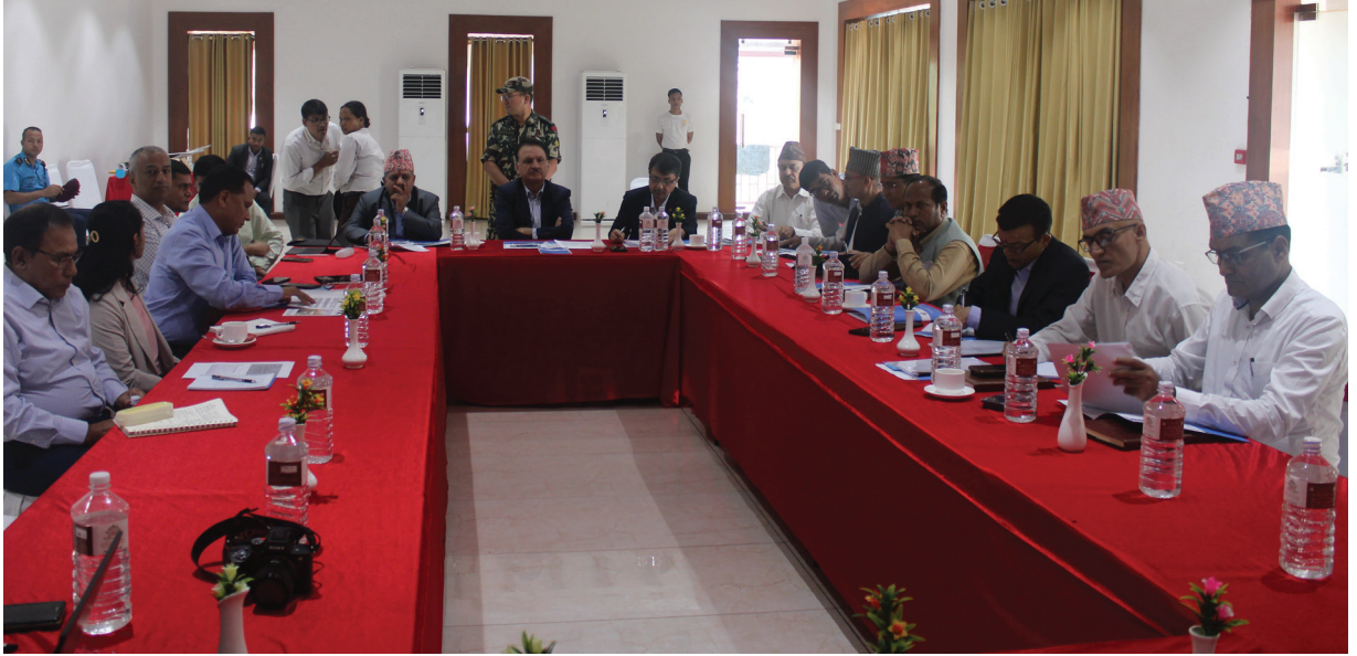
जग्गा प्राप्ति प्रक्रिया सहजीकरणका लागि बुटवल जिल्लामा २०८० साल साउन ८ गते आयोजना गरिएको कार्यशालामा आयोजना प्रभावित पाँच वटा जिल्लाका प्रमुख जिल्ला अधिकारीहरू ।

एमसिए-नेपालले आयोजना प्रभावित पाँच वटा जिल्ला तनहुँ, पाल्पा, नवलपरासी (बर्दघाट सुस्ता पश्चिम), मकवानपुरका प्रमुख जिल्ला अधिकारीहरू र नवलपरासी (बर्दघाट सुस्ता पूर्व) का सहायक प्रमुख जिल्ला अधिकारीको सहभागितामा बुटवल जिल्लामा जग्गा प्राप्ति प्रक्रियासम्बन्धी दोस्रो चरणको कार्यशाला २०८० साल साउन ८ गते आयोजना गऱ्यो । प्रक्रियासम्बन्धमा साभ्का समभ्दारी विकास गर्न आयोजित उक्त कार्यशालाको अध्यक्षता तात्कालीन अर्थमन्त्री डा. प्रकाशशरण महतले गनुभएको थियो ।