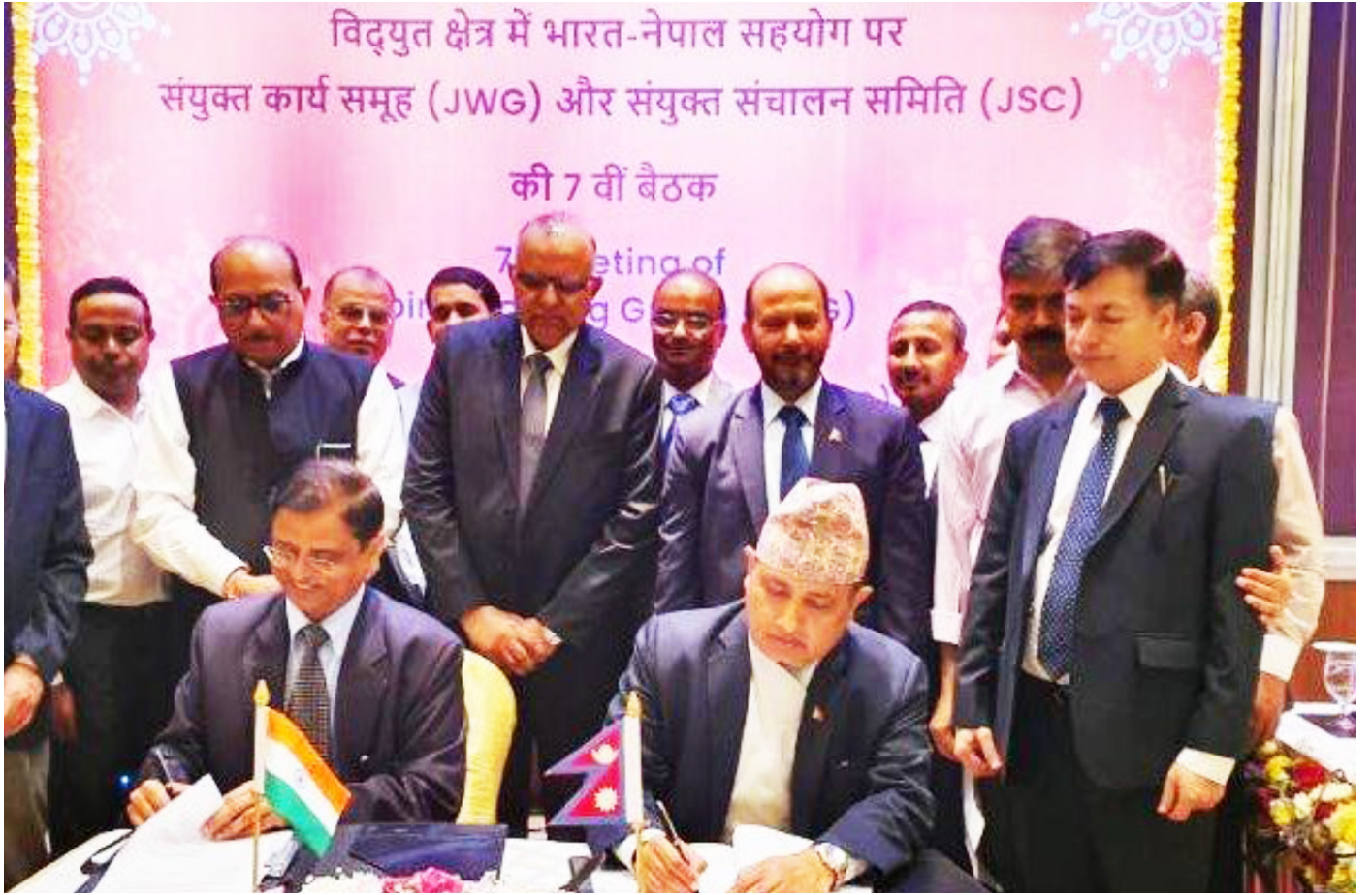
विसं २०७६ असोज २८ गते भारतको बेङ्गलुरुमा सम्पन्न सातौँ नेपाल-भारत संयुक्त निर्देशक समितिको बैठकमा नेपाल तथा भारतका अधिकारीहरू। उक्त बैठकका क्रममा नेपाल सरकार तथा भारत सरकार नयाँ बुटवल-गोरखपुर अन्तरदेशीय प्रसारण लाइन निर्माण कार्य सञ्चालनसम्बन्धी वित्तीय व्यवस्था तथा स्वामित्व संरचनामा सहमत भएका थिए।