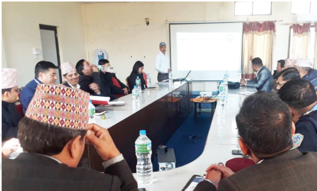
नुवाकोटको जिल्ला प्रशासन कार्यालयमा वि.सं. २०७६ माघ १५ गते मुआब्जा निर्धारण समितिको बैठक बस्दै।