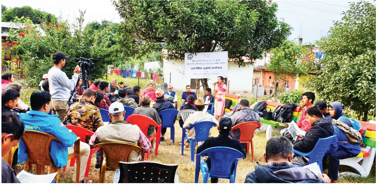
वि.सं. २०७६ मङ्सिर १३ गते चितवनको इच्छाकामना गाउँपालिकास्थित कुरिनटारमा सञ्चालन गरिएको वातावरणीय प्रभाव मूल्याङ्कनसम्बन्धी सार्वजनिक सुनुवाइ ।