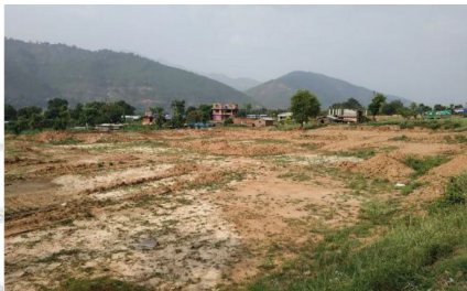
रातमाटे सब-स्टेशन निर्माण स्थल

प्रसारण लाइन क्रियाकलापको अभिन्न अङ्गका रूपमा रहेको नेपाल विद्युत् प्राधिकरणसँगको आयोजना सहायता सम्भौतालाई एमसिए-नेपालले तयार गरी अन्तिम रूप दिइसकेको छ र यसको जानकारी प्राधिकरणलाई गराई सकिएको छ । तथापि, कम्प्याक्ट अनुमोदन र कोभिड-१९ को अवस्थाले गर्दा यो कागजातमा दुई पक्षबीच छलफल र सहमति हुन बाँकी नै छ ।