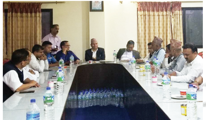
नुवाकोटको जिल्ला प्रशासन कार्यालयमा वि.सं. २०७६ फागुन ५ गते मुआब्जा निर्धारण समितिको बैठक बस्दै।