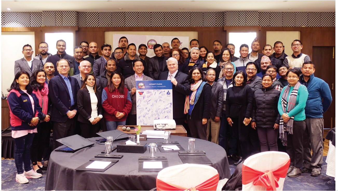
वि.सं. २०७६ माघ १ गतेदेखि ३ गतेसम्म काठमाडौँमा आयोजना गरिएको जालसाजी तथा भ्रष्टाचारविरुद्ध प्रशिक्षणमा सहभागी एमसिए-नेपालका कर्मचारीहरू ।

एमसिए-नेपालले योजनामा रहेका तालिम र कार्यशाला बाहेक पनि आफ्ना कर्मचारीलाई आन्तरिक संयन्त्र र प्रक्रियाको समन्वय तथा संस्थाको मूल्य संस्कृतिको बारे जानकारी बनाइराख्दछ । यसको सुनिश्चितताका लागि नियमित रूपमा आन्तरिक बैठक, सबै कर्मचारीबीच सामूहिक अन्तरक्रिया तथा व्यवस्थापकबीच विषय केन्द्रित बैठक आयोजना गरिन्छ । यस बाहेक त्रैमासिक रूपमा कर्मचारीको चेक-इन प्रक्रिया अपनाउने गरिन्छ । यसले गर्दा उनीहरूले आफ्ना योजना बनाउन र सुधार ल्याउनुपर्ने क्षेत्र पहिल्याउन सक्छन् । निर्धारित समयमा नै उत्कृष्ट परिणाम ल्याउन सक्षम बनाउने उद्देश्यले उनीहरूको टोलीबीचको अन्तरक्रियामा जोड दिने गरिएको छ ।