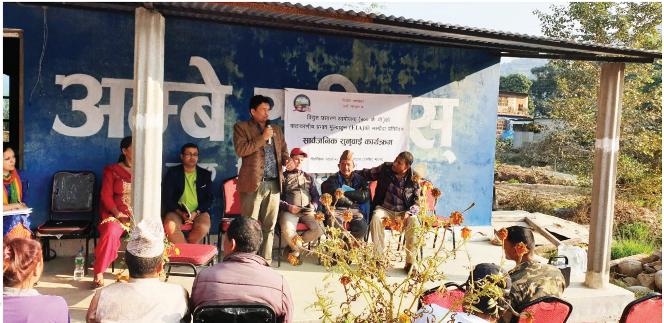
विसं २०७६ मङ्सिर १० गते नुवाकोटको लिखु गाउँपालिकास्थित छहरेमा सञ्चालन गरिएको वातावरणीय प्रभाव मूल्याङ्कनसम्बन्धी सार्वजनिक सुनुवाई ।