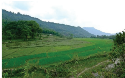
नयाँ दमौली सब-स्टेशन निर्माण स्थल