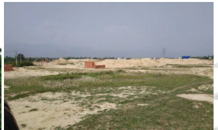
नयाँ बुटवल सब-स्टेशन निर्माण स्थल