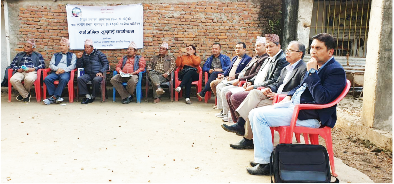
वि.सं. २०७६ मङ्सिर ८ गते नुवाकोटको बेलकोटगढी नगरपालिकास्थित रातमाटेमा सञ्चालन गरिएको वातावरणीय प्रभाव मूल्याङ्कनसम्बन्धी सार्वजनिक सुनुवाई ।

वातावरणीय प्रभाव मूल्याङ्कन प्रतिवेदन विद्युत् विकास विभागसमक्ष पेश गरिसकेपछि एमसिए-नेपालले वातावरणीय तथा सामाजिक प्रभाव मूल्याङ्कन (ESIA)को प्रतिवेदनमा काम शुरु गरेको छ । वातावरणीय प्रभाव मूल्याङ्कनसम्बन्धमा गरिएका कामको मूल्याङ्कन गरी एमसीसीका वातावरणीय नीतिहरू एवं अन्तरराष्ट्रिय वित्त निगमका वातावरण तथा सामाजिक दिगोपनासम्बन्धी कार्यसम्पादन मापदण्डहरूमा भएका प्रावधानहरू पूरा गर्नका लागि आवश्यक थप कामको दायरा तय गरिएको थियो ।