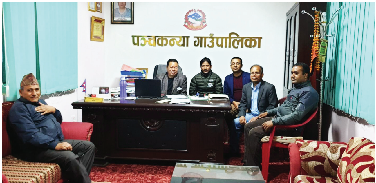
विसं २०७६ मङ्सिर ११ गते वातावरणीय प्रभाव मूल्याङ्कनसम्बन्धी सार्वजनिक सुनुवाइ आयोजनापछि पञ्चकन्या गाउँपालिकाका अध्यक्ष तथा अन्य अधिकारीसँग अन्तरक्रिया गरिँदै ।